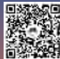
招生智能问答系统