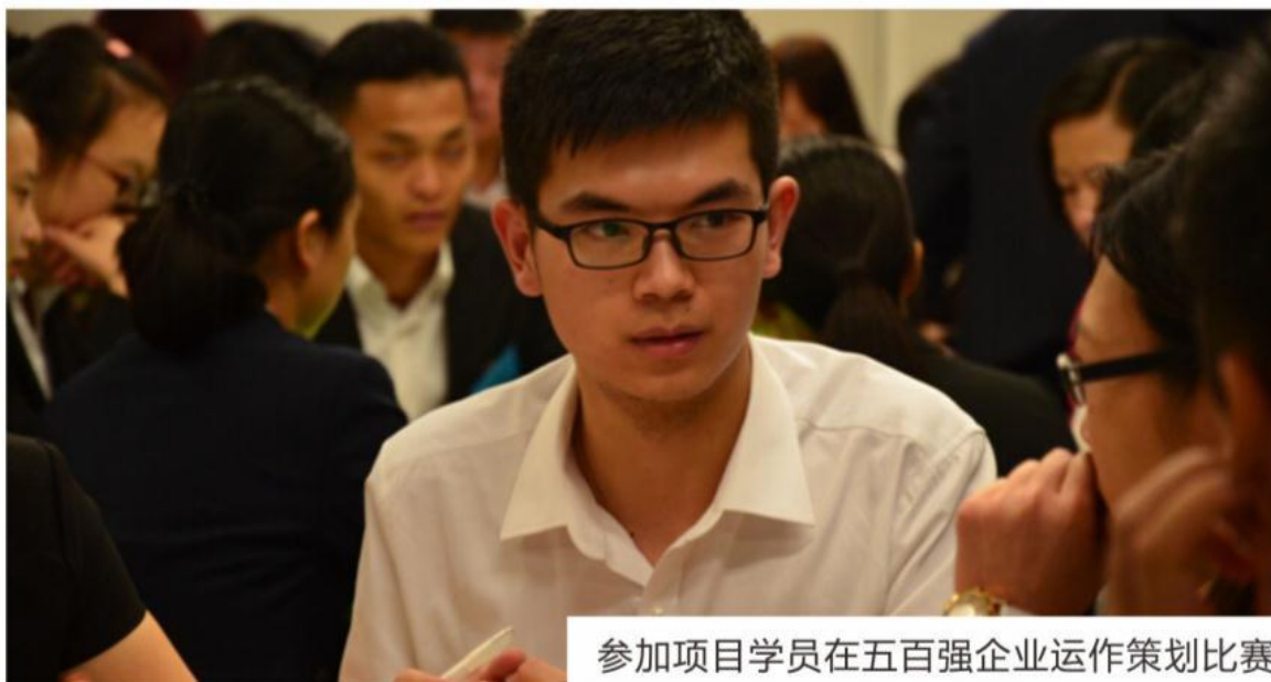
参加项目学员在五百强企业运作策划比赛

在一周内，每个团队在公司期间要参与以团队为单位的环球基金投资大赛。团队需要模拟管理个人、企业财富，在给定市场信息下以团队运作自己的基金。包括：环球经济数据发福，投资战略分析，决策制定，基金运作等环节。团队顾问和公司导师都会对参赛团队进行一定的指导。