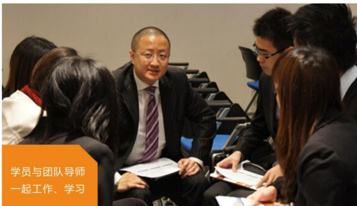
学员与团队导师 一起工作、学习